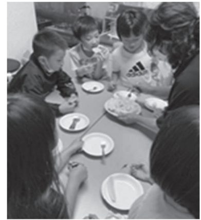
子どもの居場所づくり事業

令和3年度に引き続き、全国の共同募金会とともに、新型コロナウイルス感染下の福祉活動応援という枠組みを継続させつつ、民間の相談支援活動、食支援への活動などを中心とした支援を行うべく中央共同募金会が実施する「赤い羽根 ポスト・コロナ（新型感染症）社会に向けた福祉活動応援キャンペーン～それでもつながり続ける地域・社会をめざして～」に呼応した募金活動と支援活動を実施した。