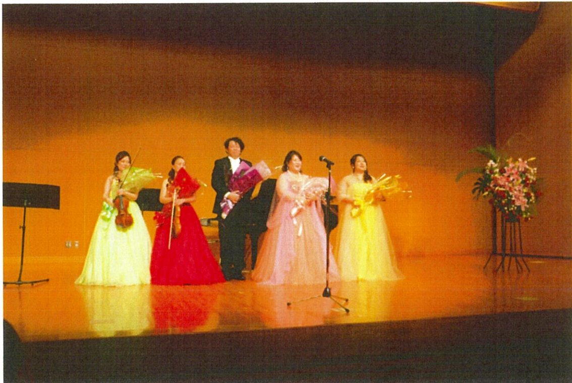
チャリティーコンサート Ensemble da camera(アンサンブルダカメラ)