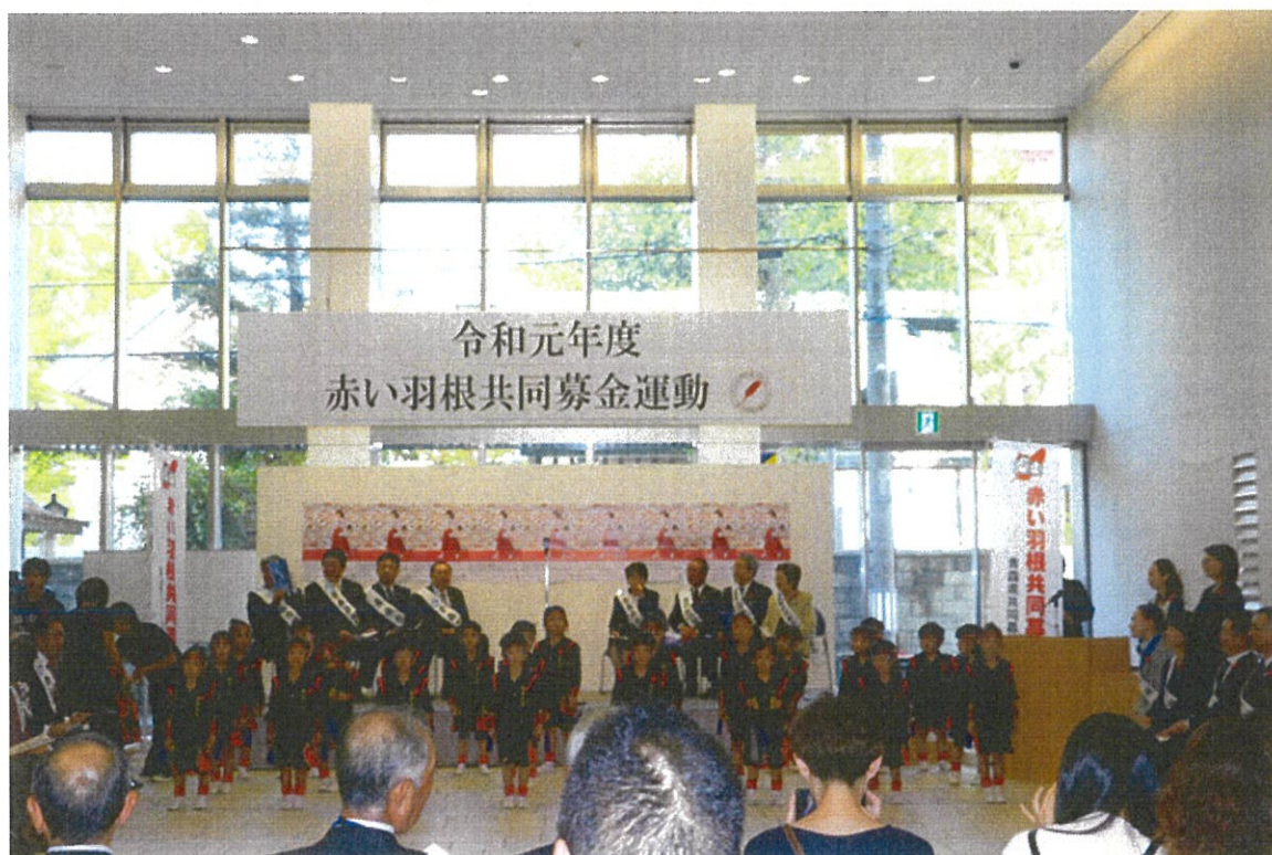
【第 73 回共同募金運動開始行事】

内 容：会長あいさつ、激励のことば（知事・市長）、赤い羽根空の第一便伝達、 厚生労働大臣・中央共同募金会会長メッセージの伝達など 開始行事終了後、街頭募金ボランティアの激励